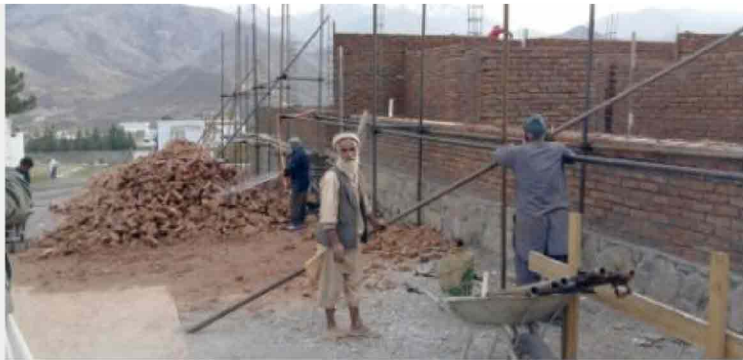
TAMassociati, Ospedale Valeria Solesin, Anabah – foto cantiere

La ricerca di soluzioni efficaci in tempi ridotti, la pericolosità dell'agire in contesti di guerra e crisi, l'onnipresente "logica infettiva della paura" cedono il passo a squarci di "bellitidine", rincorsa in un oltre decennio d'azione. Quest'ultima non si lega esclusivamente ai nuovi interventi; può avere la forma di un paesaggio di case di terra dell'Afghanistan, un' "architettura mimetica e docile" – o manifestarsi nella forma di un incontro, come avviene con l'artista Didier Kassai , che ha scelto di porre il proprio universo visionario a servizio della terra d'origine, la Repubblica Centrafricana. (V. S.)