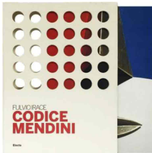
Fulvio Irace - Codice Mendini (Electa)